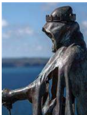
Littoral fortifié des Côtes d'Armor